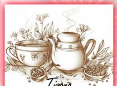
Tisana Magia delle Fate