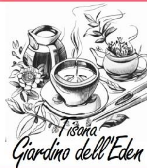
Tisana Giardino dell'Eden