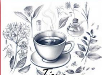
Tisana Fiore della Vita