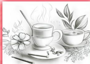
Tisana Sole e Luna