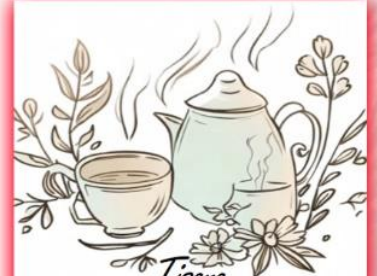
Tisana Colori della Terra