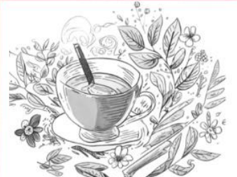
Tisana dei Chakra