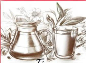
Tisana Risveglio dell'Anima