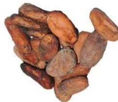
Cioccolata classica (cacao 39%)