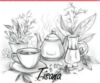
Tisana Danza delle Stelle