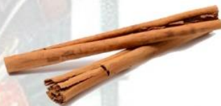
Cioccolata alla cannella (2%)