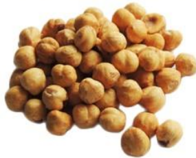
Cioccolata alle nocciole (16%)