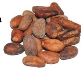
Cioccolata più gusto (cacao 60%)