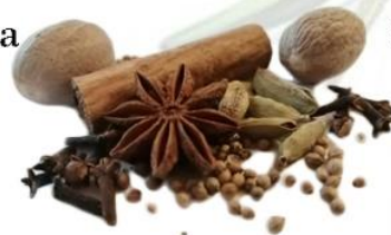
Cioccolata speziata (2%) con Anice stellato, Cannella, Chiodi di garofano, Cardamomo, Coriandolo e Nocemoscata.