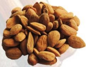
Cioccolata alle mandorle (16%)